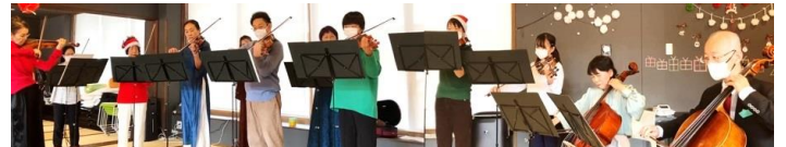
アンサンブル・ソレイユ

JOCA 東北さまのご協力のもと会場を提供していただくことができた。JOCA 東北岩沼の和室に 85 名ほどの聴衆が集まり、モーツァルトや、クリスマス曲を味わっていただいた。