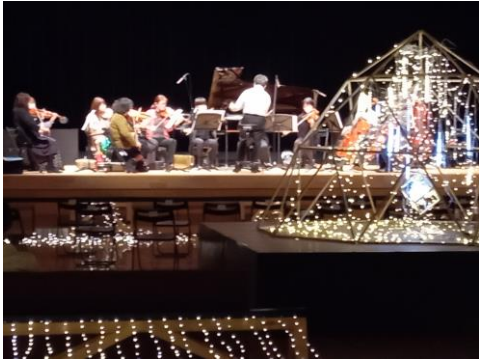
<光の回廊と音の旅>前半演奏